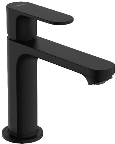
MJEŠALICA ZA UMIVAONIK Hansgrohe Rebris S